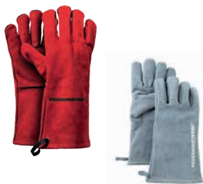
Lederhandschuh, rot FEUERMEISTERIN, grau geliefert je als Paar