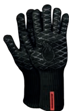
geliefert je als Paar